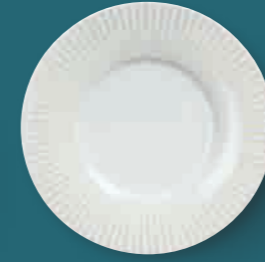
Essteller dinner plate