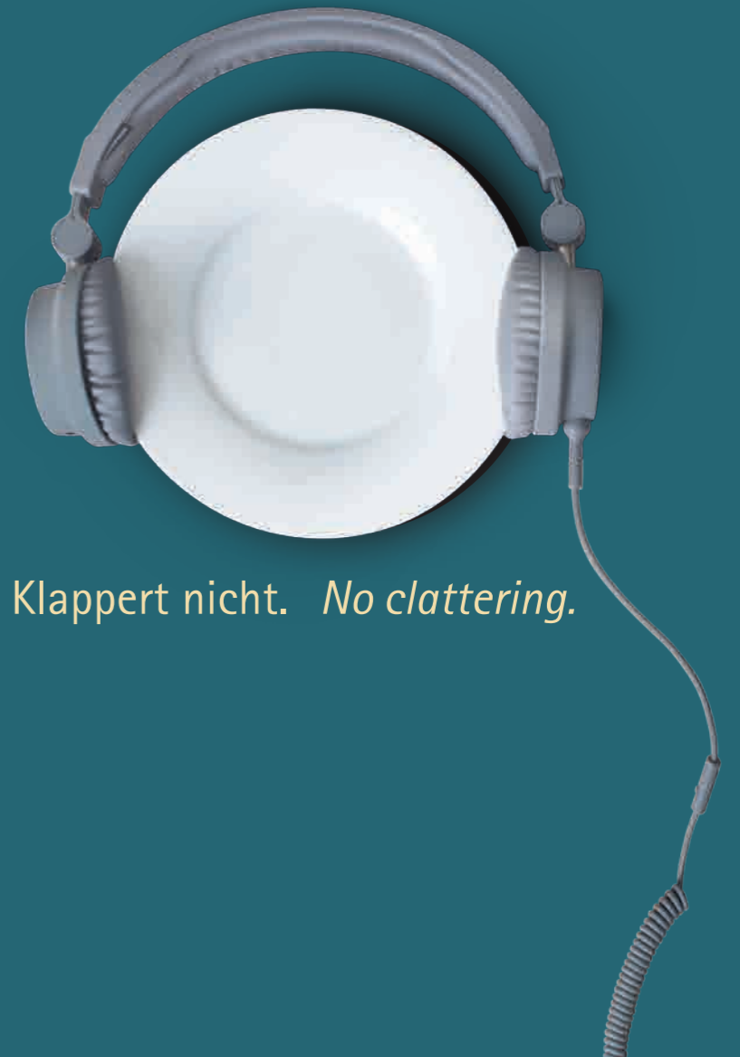
Klappert nicht. No clattering.