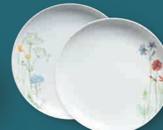
Frühstücksteller breakfast plate 22 cm Art. Nr. 39 3455