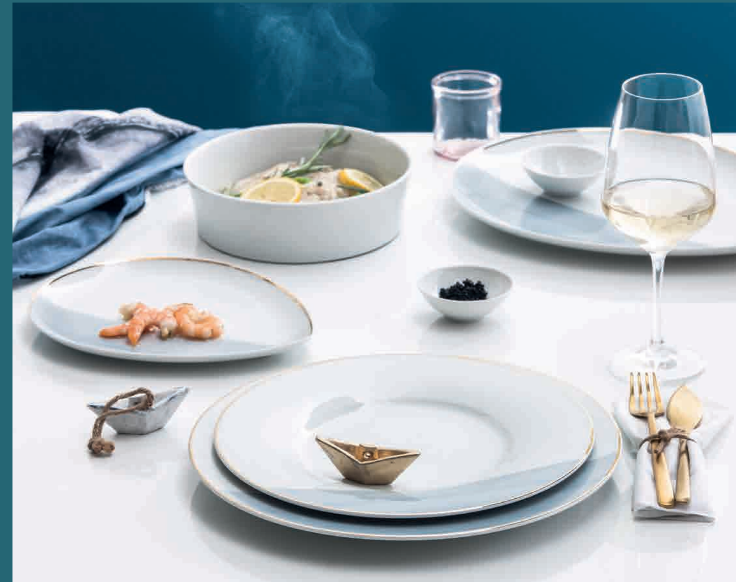
10-402 | Dekor/décor: Laura Görs