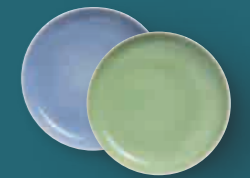
Untertasse * saucer 16 cm Art. Nr. 39 3559