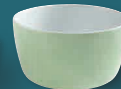
Midi-Schüssel * medium bowl 19 cm, 2,20 l Art. Nr. 39 2948