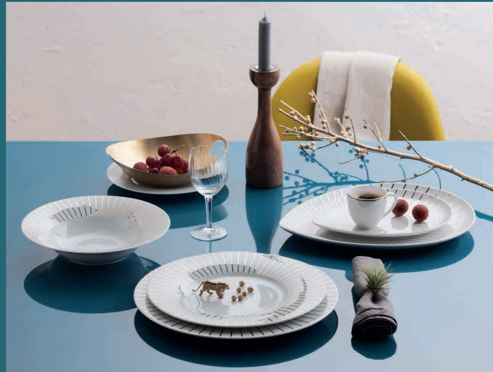
10-404 | Dekor/décor: Laura Straßer

"Ray of Gold" illuminates the white porcelain. Rays of luscious gold seem to be greeting the viewer like golden sunlight. The décor is a tribute to fine cuisine, to the chef and to the time people spend together around the table.