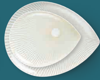
Platte midi platter medium