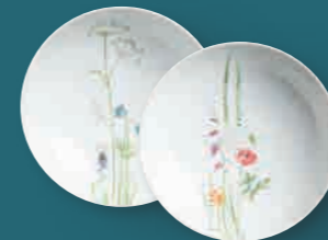
Suppenteller soup plate 21 cm Art. Nr. 39 3456