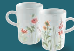
Macchiato Obertasse macchiato cup 0,35 l Art. Nr. 39 4727