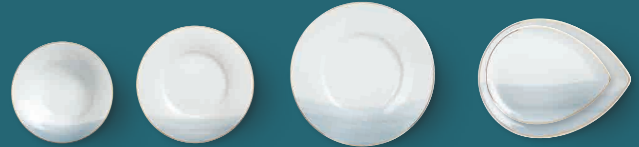
Suppenteller soup plate 24 cm Art. Nr. 55 3416

The décor "Ocean of Gold" transforms the plate into a window. Like a porthole it opens the view to the world outside onto a vast, calm sea. Subdued colours and delicate, wave-like colour flows combined with the gold rim embody serenity, luxury and relaxation.