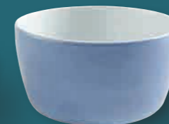
Midi-Schüssel * medium bowl 19 cm, 2,20 l Art. Nr. 39 2948