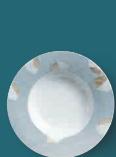
Suppenteller soup plate

The décor "Leaf of Gold" plays with the double meaning of gold leaf and is inspired by the weightlessness of the thin foil layers and by shapes found in nature. The beauty of falling leaves is linked to the warm glow cast on wet leaves by the autumn light.