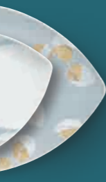
Platte maxi platter large