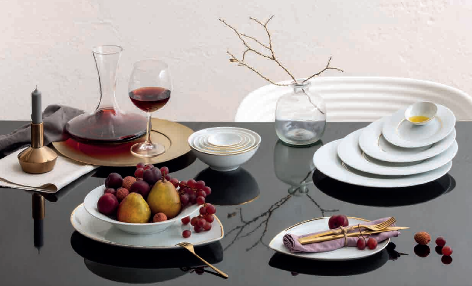
30-017, 30-018, 30-019, 30-020 | Dekor/décor: Laura Straßer