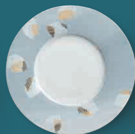
Essteller dinner plate