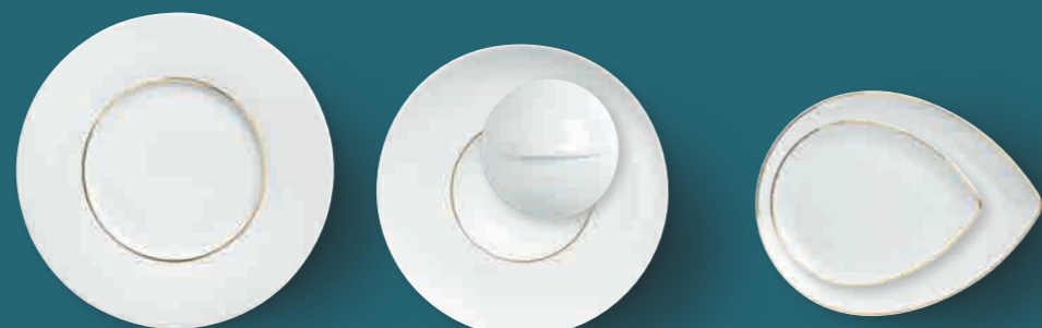
Platzteller show plate 31 cm Art. Nr. 55 3432