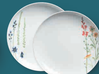
Essteller dinner plate 27 cm Art. Nr. 39 3457