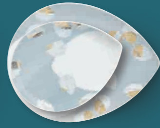
Platte midi platter medium