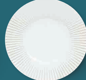
Plattteller show plate