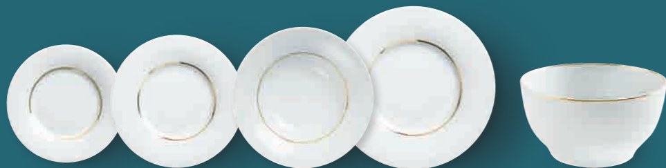
Brotteller bread plate 17 cm Art. Nr. 55 3400