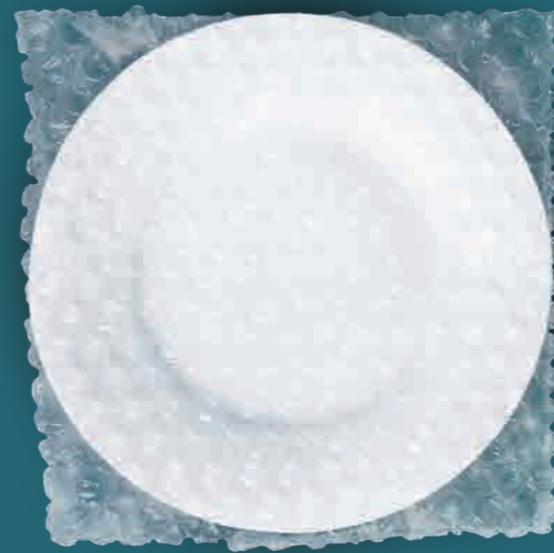
Kratzt nicht. No scratching.