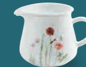
Mini-Krug + Deckel-Dip jug small + lid/dip bowl 0,50 l, 11 cm Art. Nr. 39 C108