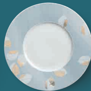
Plattteller show plate