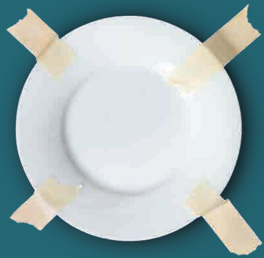
Rutscht nicht. No slipping.