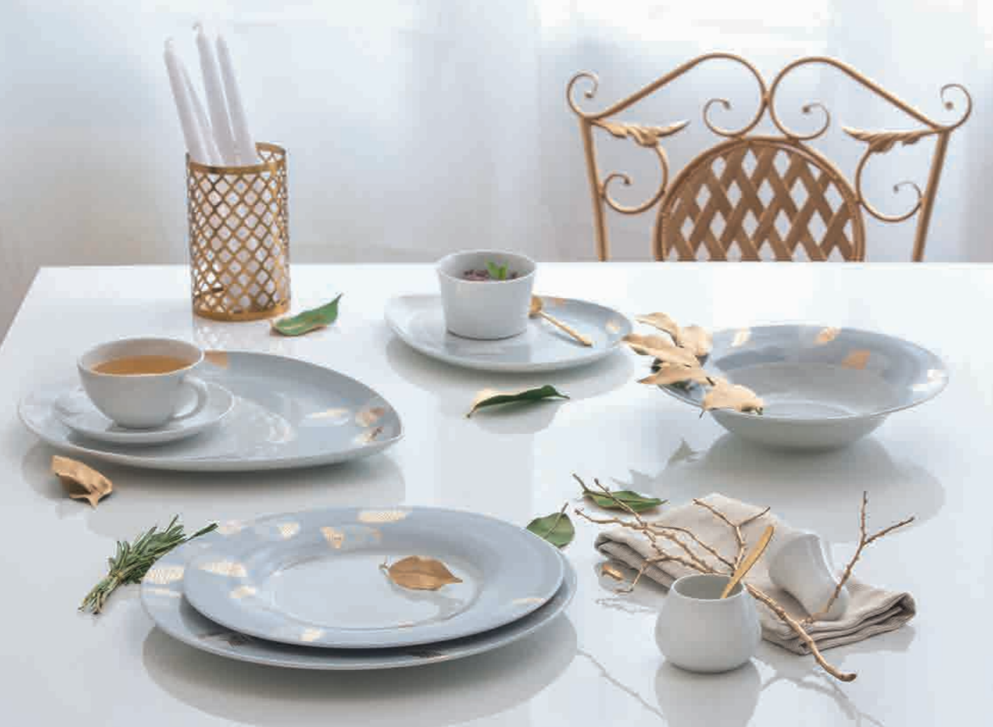
10-403 | Dekor/décor: René Buschner