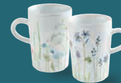
Macchiato Obertasse macchiato cup 0,35 l Art. Nr. 39 4727