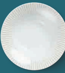
Suppenteller soup plate