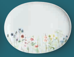
Midi-Platte medium platter 28 cm Art. Nr. 39 3328