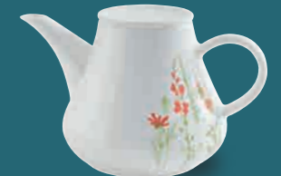
Kaffee-/Teekanne coffee/tea pot 1,50 l Art. Nr. 39 1125